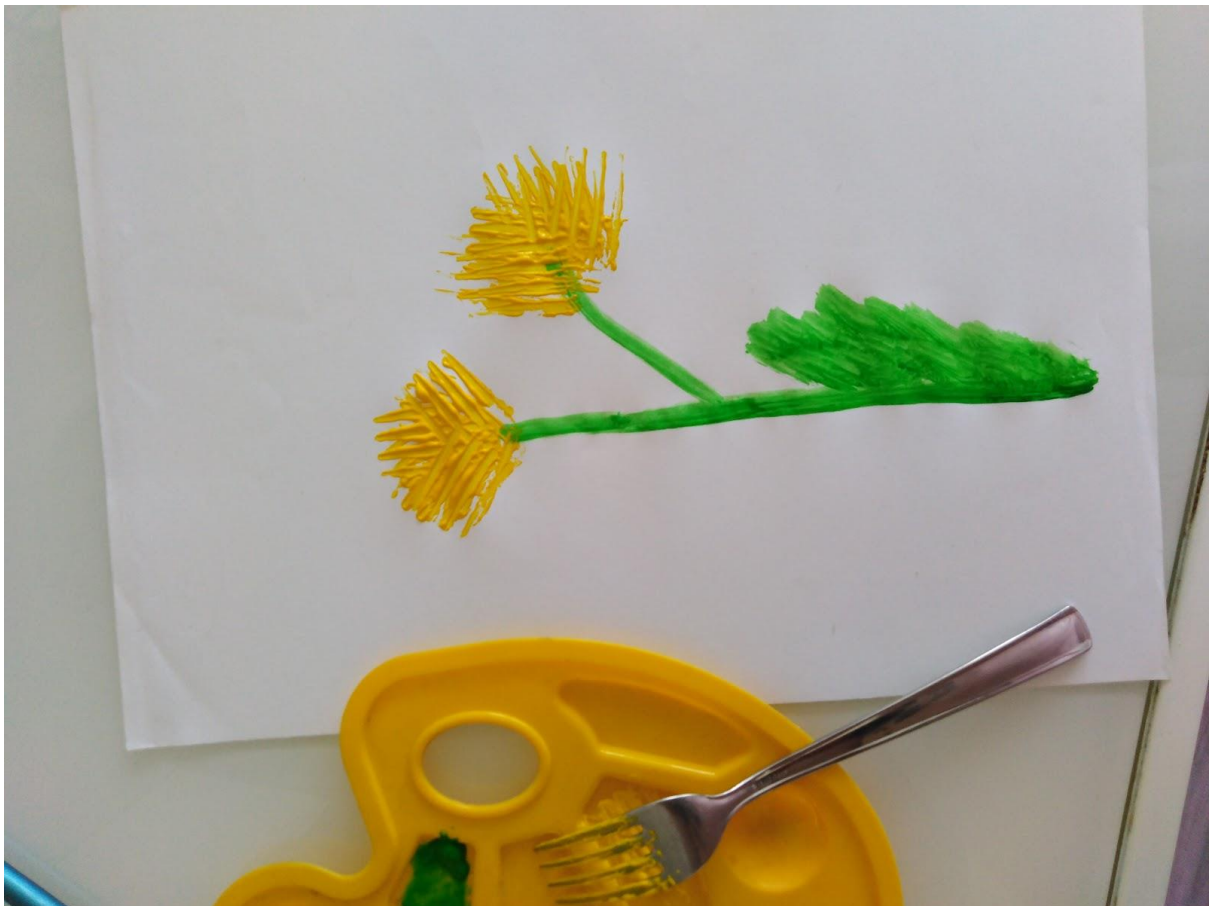
2020. DV CVRČAK-SOLIN.SVA PRAVA PRIDRŽANA