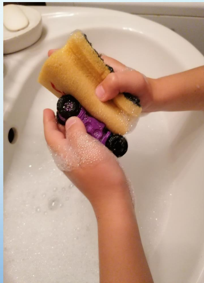
2020. DV CVRČAK – SOLIN. SVA PRAVA PRIDRŽANA